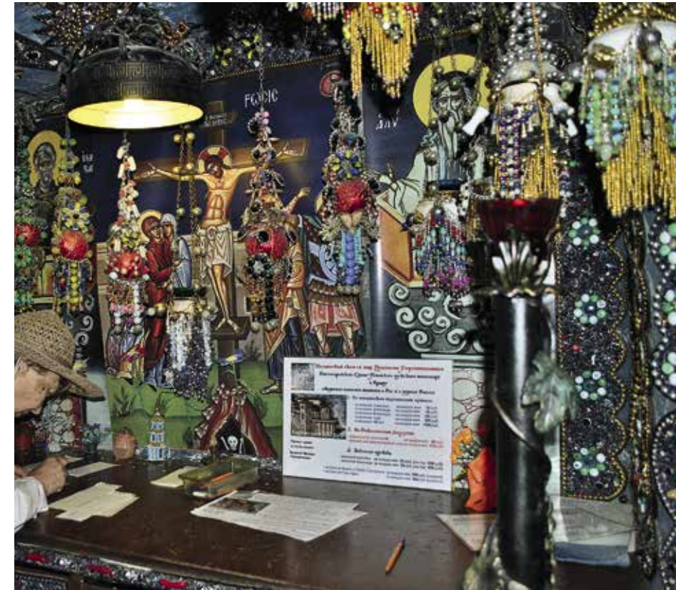
Пещерный храм Анастасии-Узорешительницы в Качи-Кальоне

Со всеми достопримечательностями Крыма можно ознакомиться, купив один из туров паломнического отдела Симферопольской и Крымской епархии. Эти как однодневные, так и многодневные туры с проживанием в комфортных гостиницах охватывают монастыри и храмы центрального и западного, юго-западного, южнобережного (ЮБК) и юго-восточного Крыма. Отделом разработаны более ста однодневных поездок в разные места Крыма по редким паломническим маршрутам. Подробная информация, а также виртуальные туры по пещерным монастырям и Херсонесу размещены на сайте отдела: palomnik.crimea.com Библиотека электронных книг по Крыму: http://www.krimoved-library.ru/books/index.html