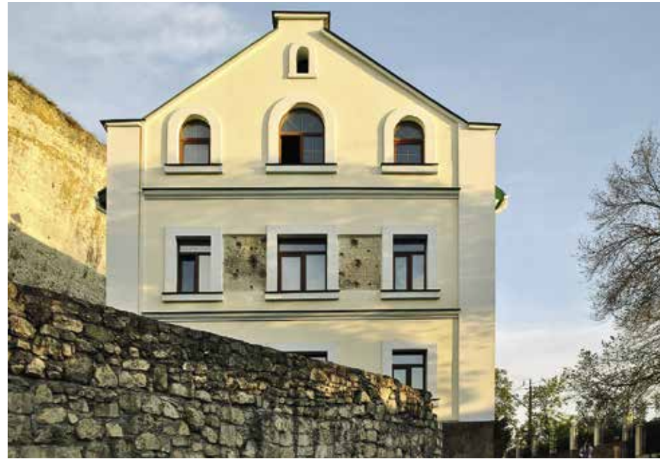
Инкерманский Свято-Климентовский мужской монастырь (вверху — следы от снарядов на фасаде времен Великой Отечественной войны), внизу — костница насельников монастыря

Приблизительно в 20 км от Херсонеса, в Инкерманском Свято-Климентовском мужском монастыре, находится один из самых ранних христианских храмов полуострова. Это храм священномученика Климента, епископа Римского, по преданию, сделанный им из вырубленного (при добыче облицовочного камня) пещеры. Паломнику может показаться, что время приостанавливается, когда он