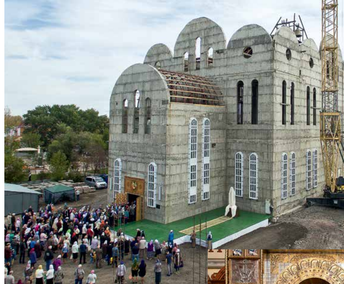
Троице-Севастиановский собор г. Караганды (вверху). Рака с мощами преподобного Севастиана. Введенский кафедральный собор (справа)