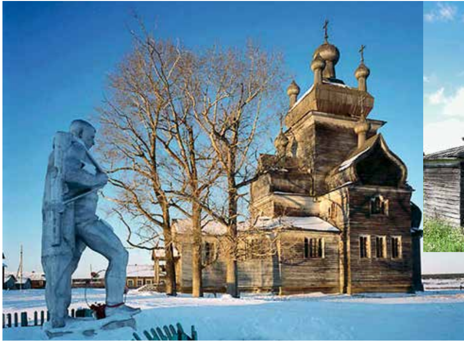
Часовня в Ракуле до и после ремонта (вверху). Преображенская церковь с. Турчасово (Онежский район) (слева вверху). Никольский храм в д. Погост (Холмогорский район)